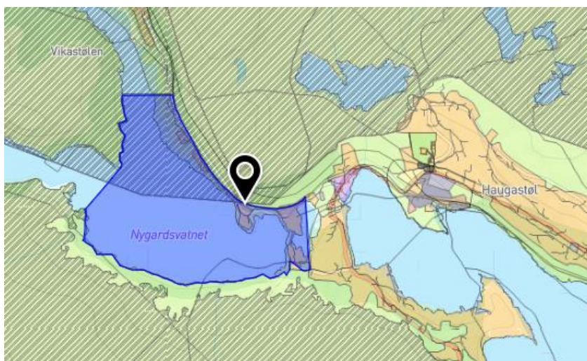
Figur 1. Nygard del 1 (planid: 062009003; vedtatt 24.4.1983). Planavgrensing markert i blå farge.