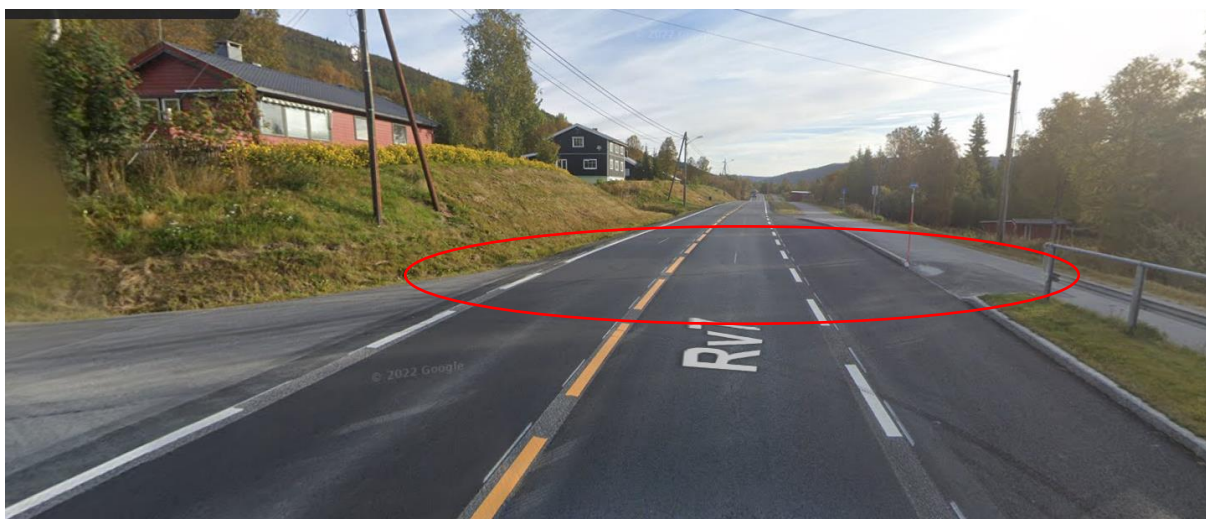
Figur 3. tilrettelagt kryssing pr 2022/2023 sett mot øst