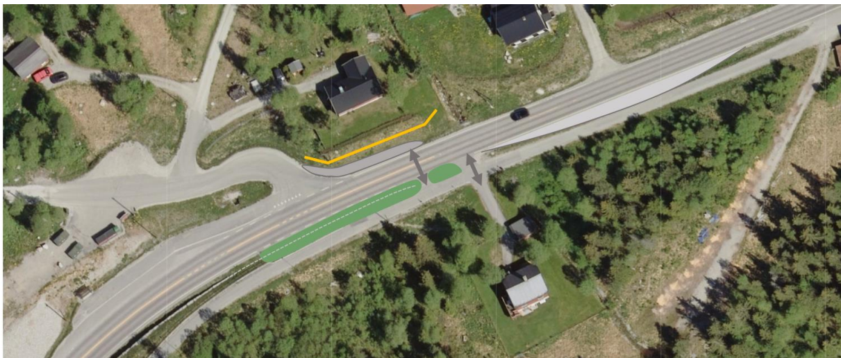
Figur 5. Forslag til tiltak (illustrasjon)

Det anbefales at tiltaket innarbeides i reguleringsplanen for byggefeltet.