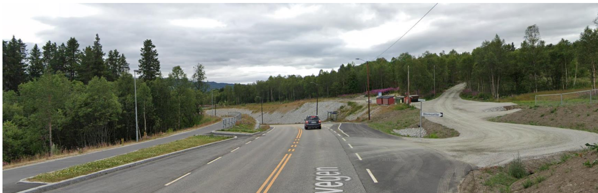
Figur 2. Tilrettelagt kryssing pr. 2018 sett mot vest

Dagens beliggenhet av kryssingspunktet ligger i busslommen der busslommen er på det bredeste. Total veibredde ved kryssingspunktet er ca 10m.