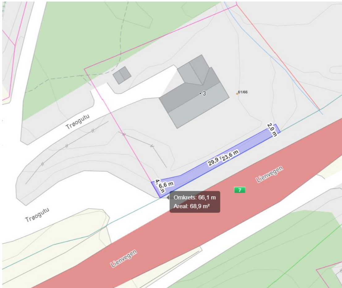
Figur 6. Foreslått tiltak vil kreve et eiendomsinngrep på eiendommen 61/66.