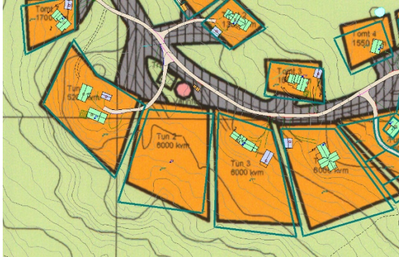
Figur 1 Utsnitt gjeldende reguleringsplan mot eksisterende eiendomsgrenser (grønn strek)

Endringsforslaget legger opp til at formålsgrensene i planen samsvarer med oppmålte eiendomsgrenser. Administrasjonen er positive til dette, da flere av tomtene innenfor planområdet til nå også delvis har vært regulert til jord- og skogbruk, som følge av at det ikke har vært samsvar mellom formålsgrenser/regulerte tomtegrenser og eiendomsgrenser. Endringsforslaget vil medføre at samtlige fritidstomter nå i sin helhet reguleres til fritidsbebyggelse.