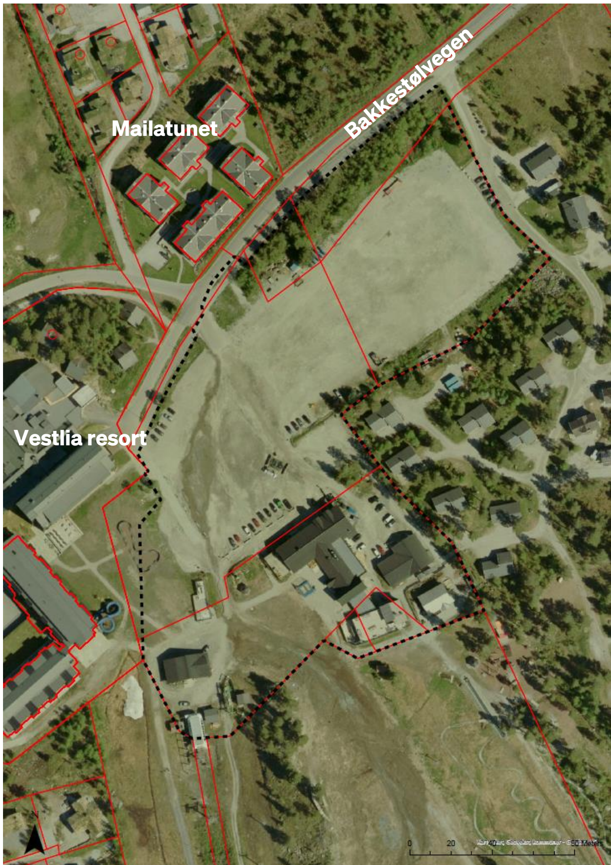
Figur 1 Oversiktsbilde med forslag til planavgrensning markert i svart stiptet linje. Planavgrensningen følger formålsgrenser i områdeplanen.