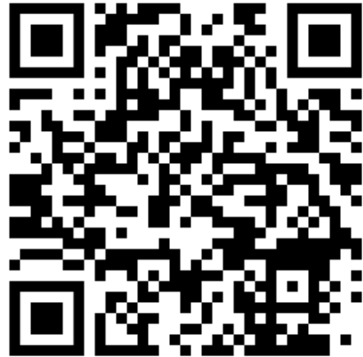
QR-kode for iOS

Her velger du hvilken kommune(r) du ønsker å følge ved å trykke på ønsket kommune som vist under her: