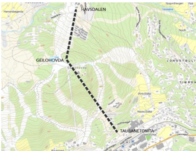
Figur 1: Bildet viser traseen for ny gondol fra Taubanetomta i Geilo sentrum til Geilohovda, med forlengelse til/fra Havsdalen.

Utredningsprogrammet gir en kortfattet oversikt over planens innhold og rammer, vurdering av utredningstemaer, medvirkningsprosess og fremdrift. Det vises for øvrig til planinitiativet med vedlegg for gjennomgang av planområdet, tiltak og detaljer knyttet til planen.