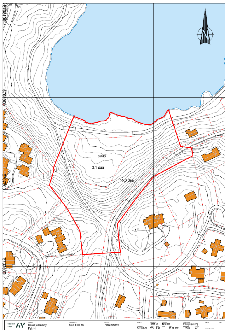
Figur 2: Foreløpig plangrense er vist med rød heltrukket strek.

I utsnittet under sees foreløpig plangrense. Foreløpig plangrense er vist med rød heltrukket strek. Felt 14 avsatt i kommuneplanens arealdel og reguleringsplan for Geilo Fjellandsby er vist med rød stipla eiendomslinje.