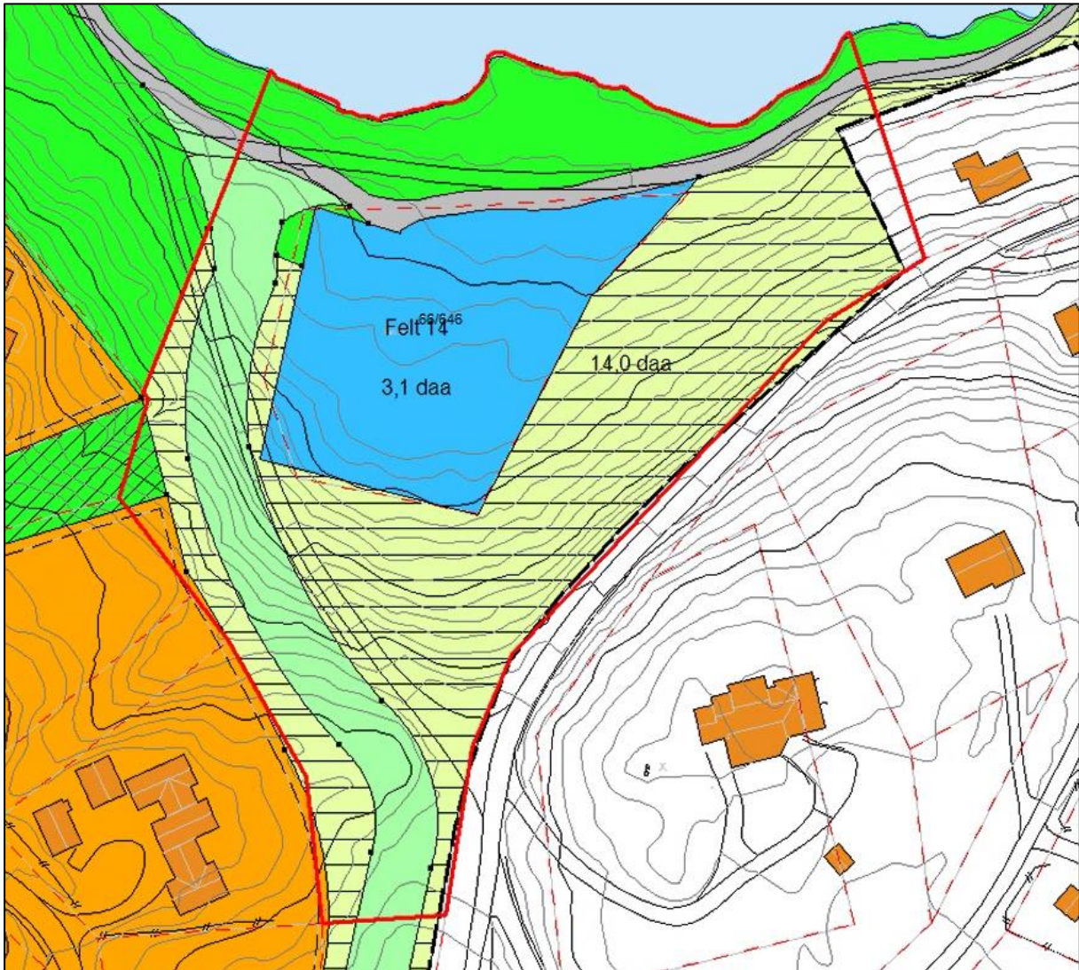
Figur 4: Utsnitt gjeldende reguleringsplan for Geilo Fjellandsby. Rød linje viser foreløpig planavgrensning.

Reguleringsplanen for Geilo Fjellandsby blir utfylt av bebyggelsesplan for felt 8, felt 14 og felt 18 i Geilo Fjellandsby (PlanID 062004103).