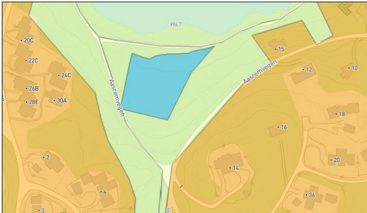
Figur 3: Utsnitt kommunedelplan for Geilo.

Planområdet er i kommunedelplan for Geilo (PlanID 400-2010) avsatt til arealbruksområde erverv og LNF.